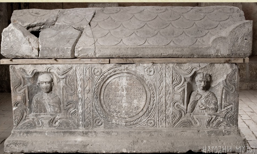
Sarkofag III vek.

Da nije bilo Jungove posvećenosti prema arheologiji, sada za mnoge uništene lokalitete ne bismo ni znali da su ikada postojali.