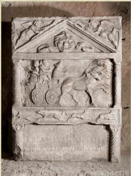
Nadgrobnni spomenik Kostolac

Trenutno ujedno i Priča va, ali se pojavila preme sivne