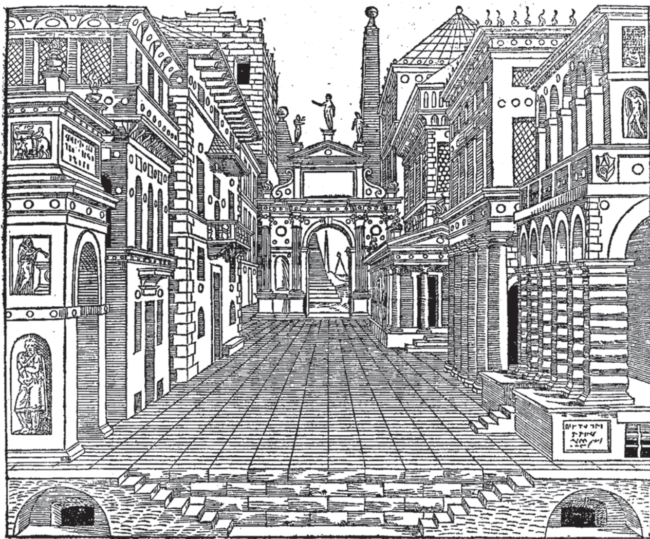
Себастијано Сирило, Трагична сцена