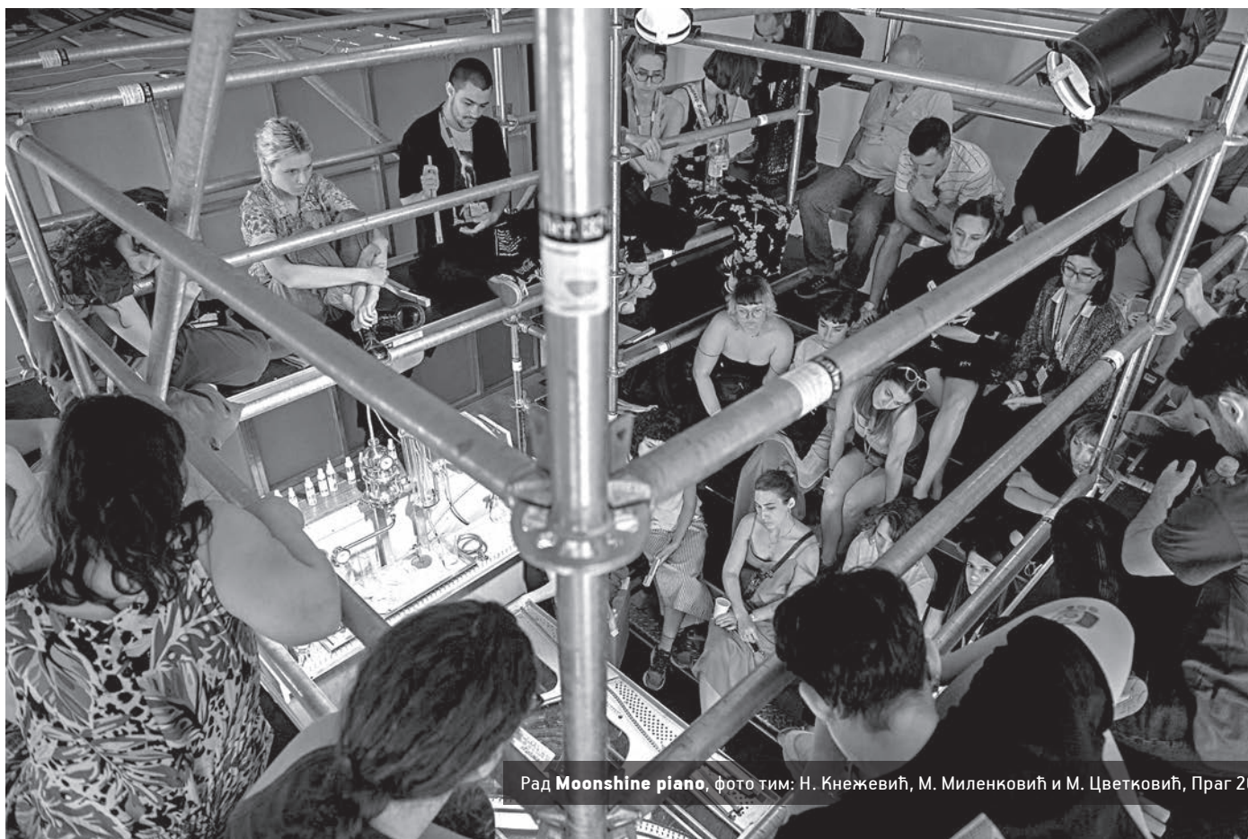
Рад Moonshine piano , фото тим: Н. Кнежевић, М. Миленковић и М. Цветковић, Праг 2023.

Уколико с нивоа просторне поставке, пређемо на локацију на којој се она налазила, место рада морамо посматрати кроз две равни. Шире гледано, локација Прашке тржнице, као просторног оквира Прашког квадријенала, није у великој мери утицала на развој поставке павиљона Србије; Moonshine Piano је креиран тако да може функционисати у различитим контекстима, генеришући микрозаједницу у себи и око себе, а назив добијене награде, „за активирање заједнице“, говори у прилог томе. Ипак, у ужем смислу речи је место (парцела 37 хале 13) на коме је Србија излагала у