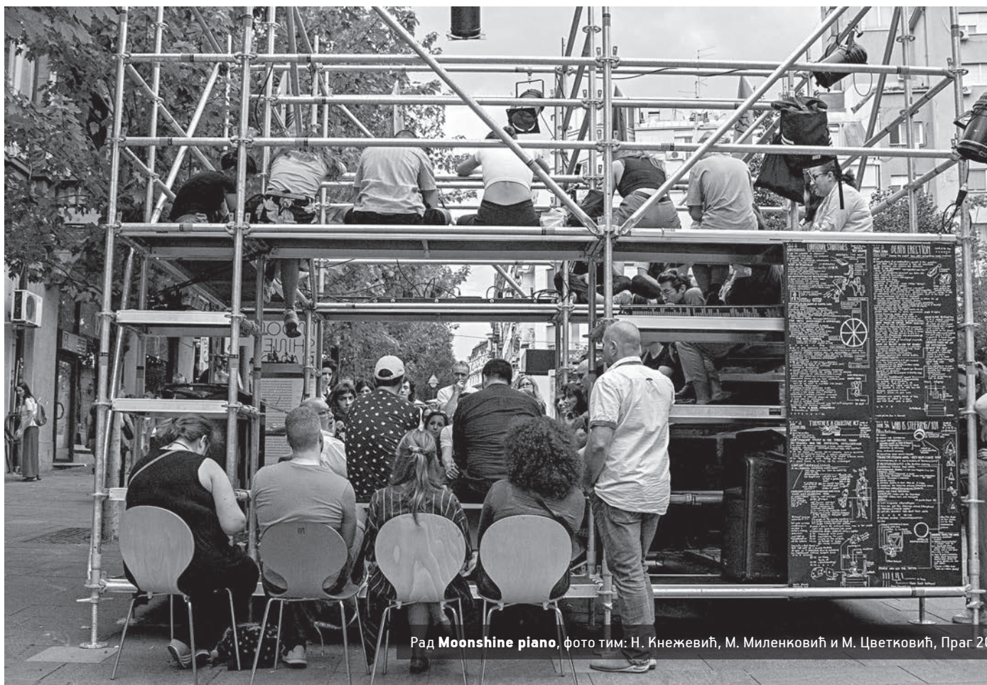
Рад Moonshine piano , фото тим: Н. Кнежевић, М. Миленковић и М. Цветковић, Праг 2023.

тилизација сценских простора или сценских догађаја. Упркос чврстом ставу и разумевању области продукције као пре свега практичне, управо теоријско дефинисање претходно написаних појмова видим као први корак развоја различитих приступа теми постпродукције сценског простора.