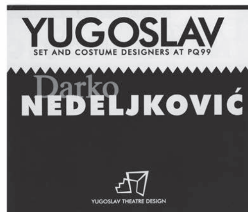
Učešće na Praškom kvadrifjenalu 1999. godine