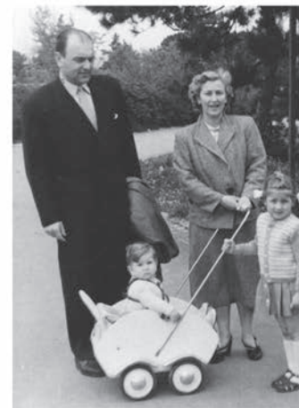
Kalemegdan 1956. – tata, mama, sestra и ja